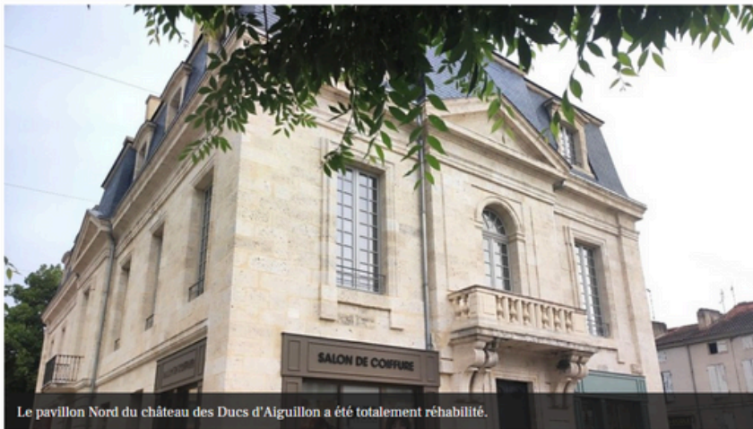
Le pavillon Nord du château des Ducs d'Aiguillon a été totalement réhabilité.